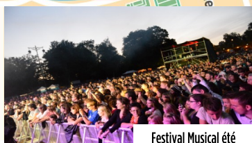
Festival Musical été